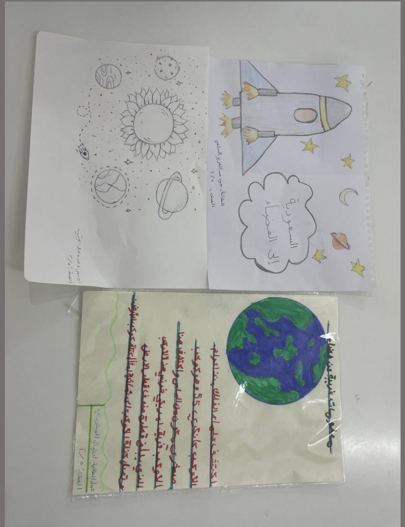
قائدة المدرسة: علوية السيد