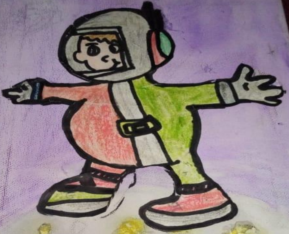
مشاركة الطالبة الهنوف يحي الجابري الصف السادس