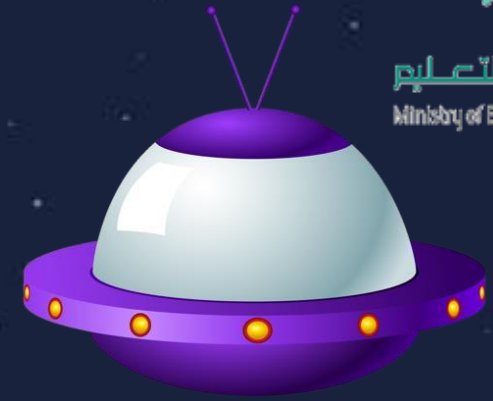
أقمار الاتصالات الصناعية