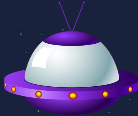
أقمار الاستطلاع الصناعية