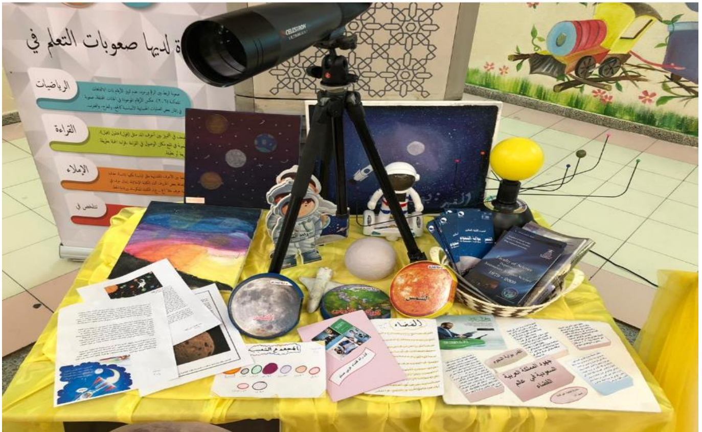
قائدة المدرسة : أمل الحربي