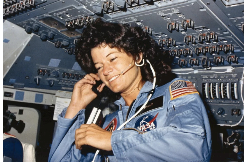
سالي رايد أول امرأة أميركية تطير إلى الفضاء