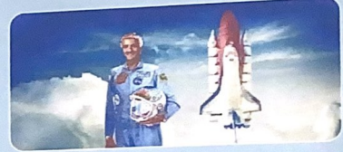
صاحب السمو الملك الأمير : سلطان بن سلمان بن عبد العزيز آل سعود