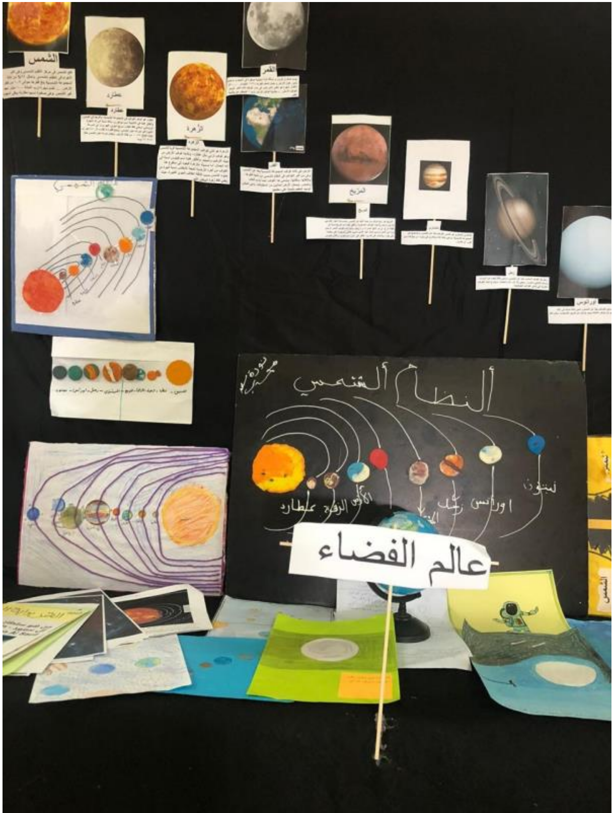
الفضاء أسبوع ركن - 2